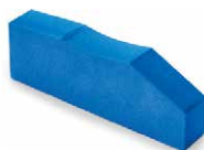
EVA 100 - 30 Shore A EVA 200 - 40 Shore A