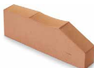
XTREME 24 Shore A