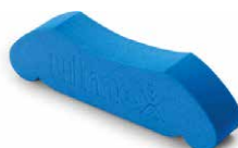
XTREME PLUS Colour Beige 13 Shore A Colour Blu 18 Shore A